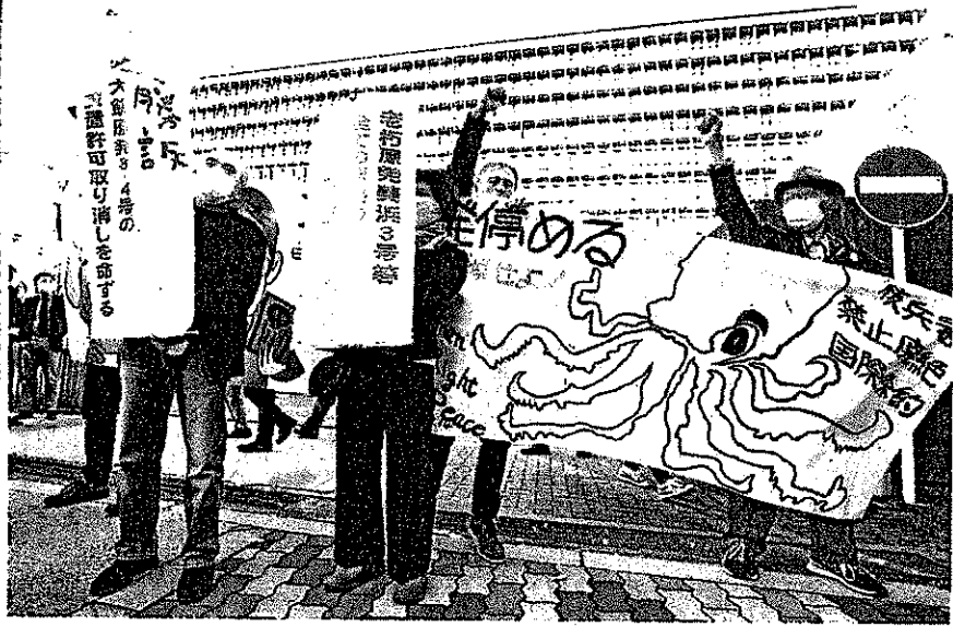
関西電力大飯原発3、4号機の設置変更許可を取り消した大阪地裁判決後、懸断の垂れ幕を掲げる原告ら。4日午後、大阪市北区