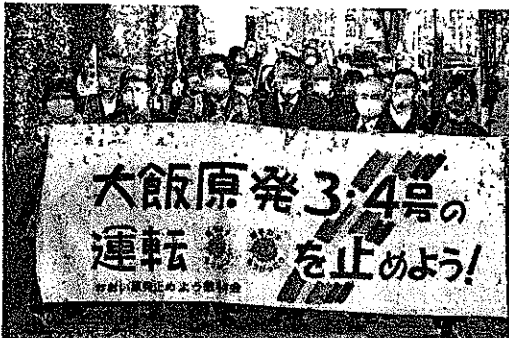
関西電力大飯原発3、4号機の設置変更許可処分を取り消しを求めた訴訟で、大阪地裁に向かう原告ら=4日午後、大阪市北区

根拠となる活断層や周辺の断層の影響を過小評価してきたのが日本の原子力行政です。大飯原発でも、付近にある活断層と周辺の断層が連動することで大きな地震や津波が発生すると指摘されてきました。また不確定な部分も多くありながら、国